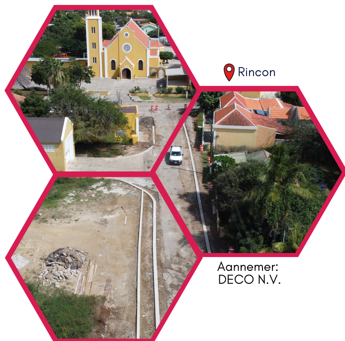
Aannemer: DECO N.V.

De werkzaamheden aan de Kaya C.D. Crestian zijn later aangevangen dan gepland. Gezien de uitdagingen voor het volgende jaar is er besloten om toch een eerste fase van de Kaya C.D. Crestian uit te voeren. Dit is inmiddels ook gebeurt. In deze eerste fase is de duikerdek hersteld en betonnen banden werden aangebracht. Daarnaast is er aan de zuidkant van de weg een beklinderd trottoir aangebracht en de noordkant werd voorzien van asfaltbermen. In deze weg is er gekozen om geen verhoogde trottoir aan te brengen. Gezien de aanwezige voorzieningen en het karakter van de woonstraat is gekozen om de trottoir gelijkvloer toe te passen.