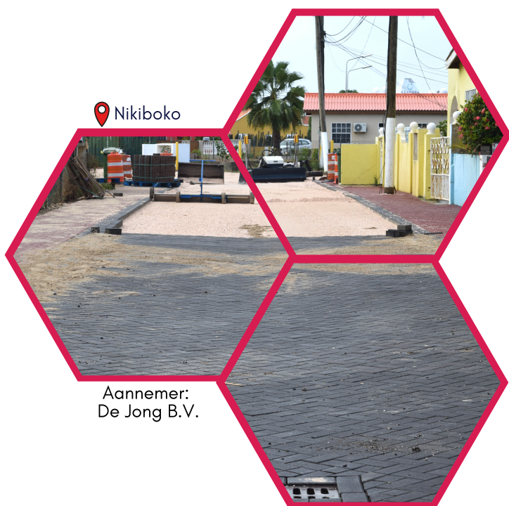
Aannemer: De Jong B.V.

Renovatie van Kaya Roma is afgerond. Net als bij Kaya Brusselas zijn de werkzaamheden in de maand oktober aangevangen. De oude asfaltweg is volledig vervangen voor een nieuwe beklinderd weg. De hemelwaterafvoer geschiedt net als bij Kaya Brusellas via infiltratie naar de grondwater, en het overmatige hemelwater wordt via het afvoersysteem van Kaya Nikiboko Zuid afgevoerd.