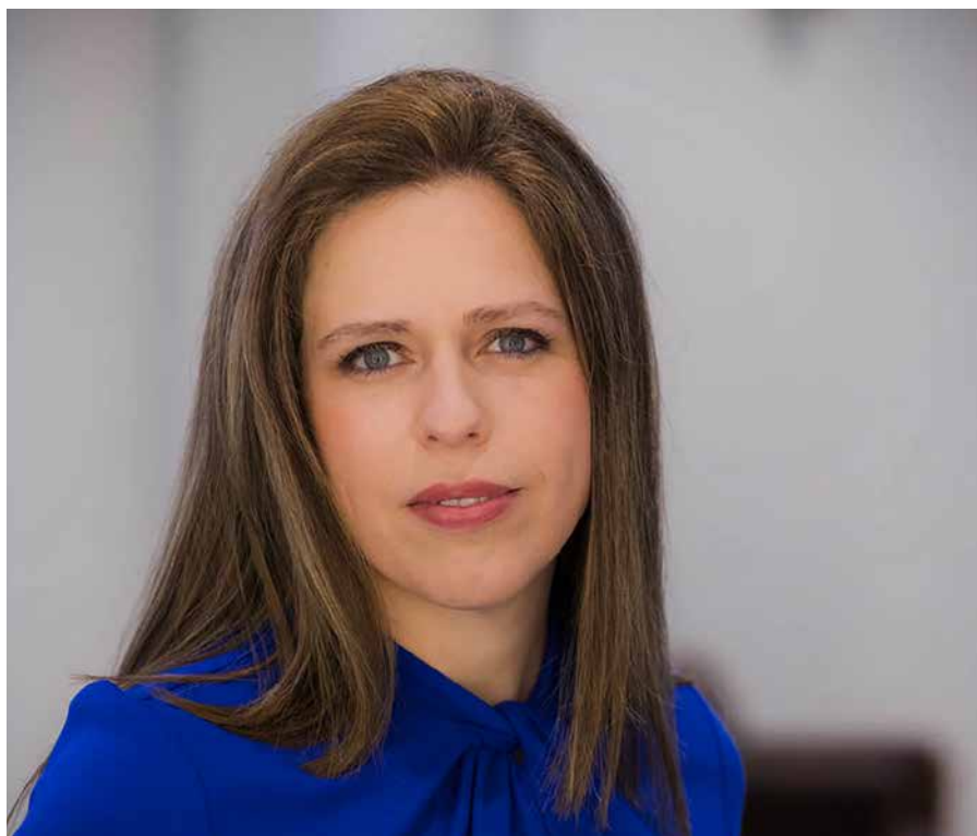
Minister Carola Schouten: „Een gezonde natuur draagt bij aan de economische ontwikkeling van de eilanden.“