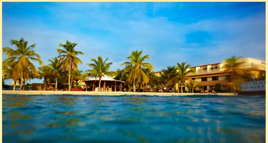
Bonaire biedt bezoekers een veilige anderhalve-meter-vakantie.