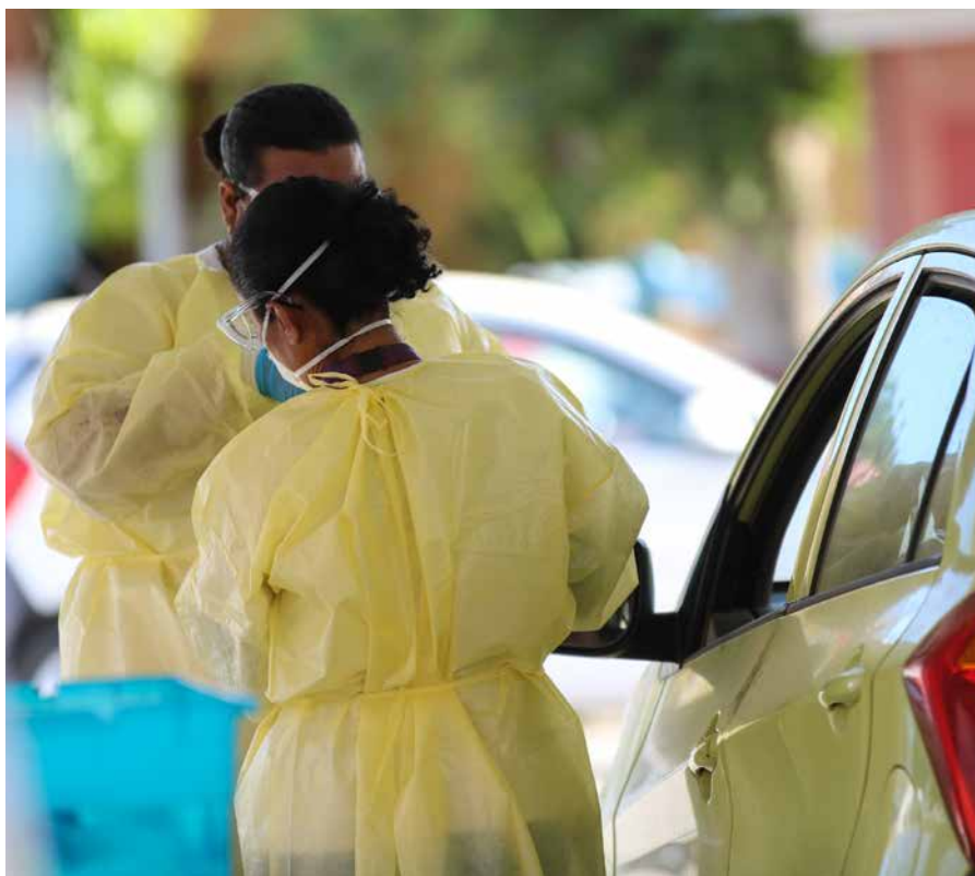
De drive-thru waar bijna driehonderd Bonairianen zich lieten testen. Geen van hen bleek besmet.

Niettemin wordt het verantwoord geacht de maatschappij geleidelijk