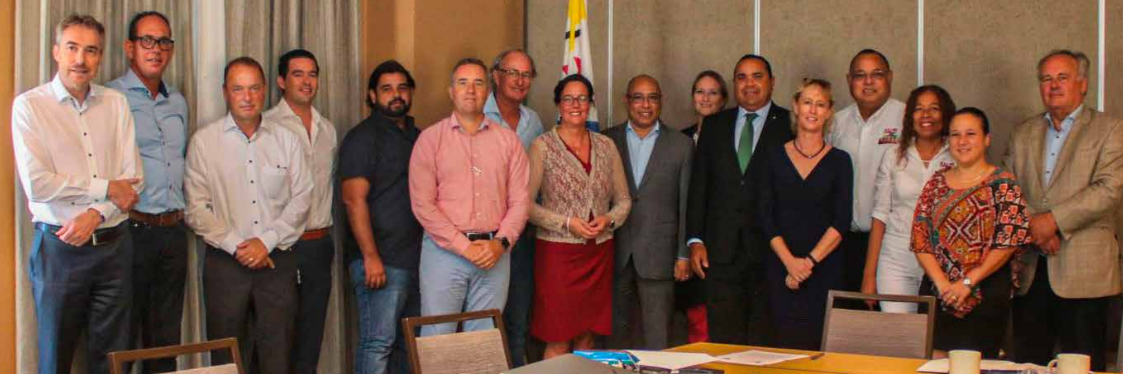
Tijdens haar werkbezoek aan Bonaire woonde staatssecretaris Tamara van Ark een vergadering van de Centraal Dialoog bij.