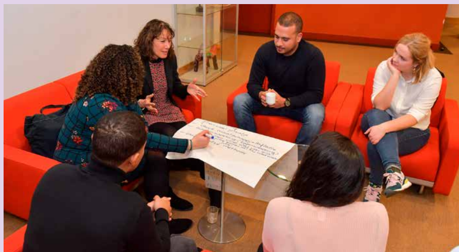
De deelnemers gingen in werkgroepen aan de slag om na te denken over de ontwikkeling van Bonaire.