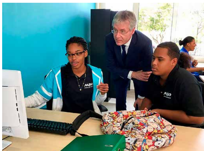
Minister Slob tijdens zijn bezoek aan de mbo-sectie van de Scholengemeenschap Bonaire.