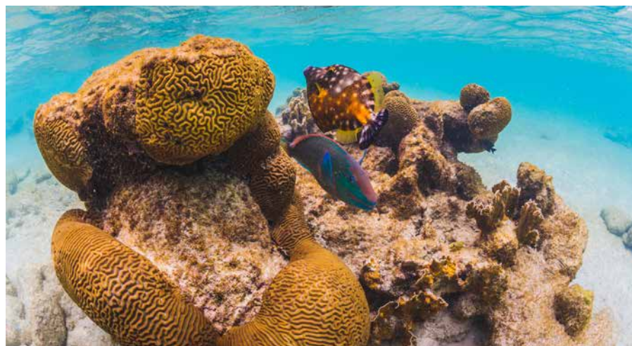
Slechts een paar stappen van het strand opent zich een kleurrijke onderwaterwereld.

De expeditie ontving lokale steun van Stichting Nationale Parken Bonaire (STINAPA) en de Dutch Caribbean Nature Alliance (DCNA).