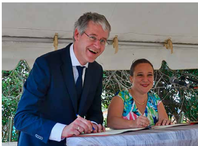
Minister Arie Slob en gedeputeerde Nina den Heyer bij de ondertekening van het onderwijshuisvestingsconvenant.