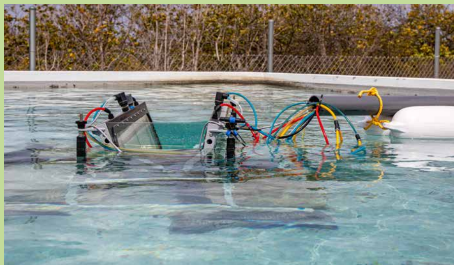
Het buitenbassin met de door Wageningen University & Research ontworpen reactor.