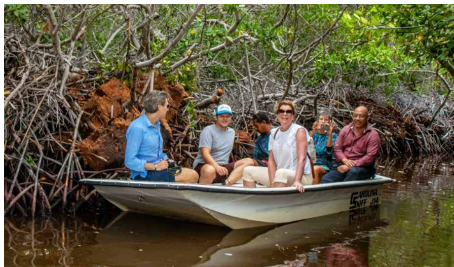
Op uitnodiging van Mangrove Maniacs maakte minister Van der Wal een tochtje door de mangroven bij Lac Bay.

vrijwilligers van tijd tot tijd opruimacties houden, verdient het gebied vanwege zijn grote ecologische waarde professioneel beheer. Omdat de aankoop past in het Natuur- en Milieu-