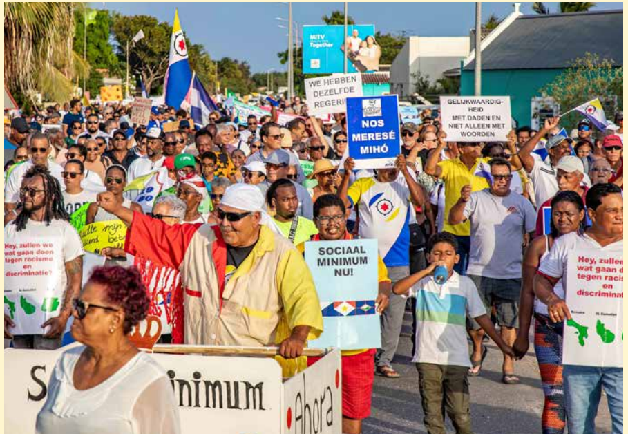
In mei van dit jaar gaven Bonairianen massaal gehoor aan de oproep van de vakbonden om te demonstreren tegen het uitblijven van een leefbaar bestaansminimum.

“Op basis van alle input hebben we onze bevindingen en adviezen zo scherp mogelijk geformuleerd. Het is duidelijk dat het huidige ijkpunt sociaal minimum ver onder het bedrag ligt wat echt nodig is om rond te komen. Ik ben tevreden met het resultaat. We geven een helder antwoord op de vraag wat een huishouden nodig heeft om waardig te leven en te kunnen deelnemen aan de samenleving. Als commissie vinden we dat het kabinet zo snel mogelijk het sociaal minimum moet vaststellen en invoeren. Het liefst per 1 januari, maar dat is niet aan ons. De politiek is nu aan zet.”