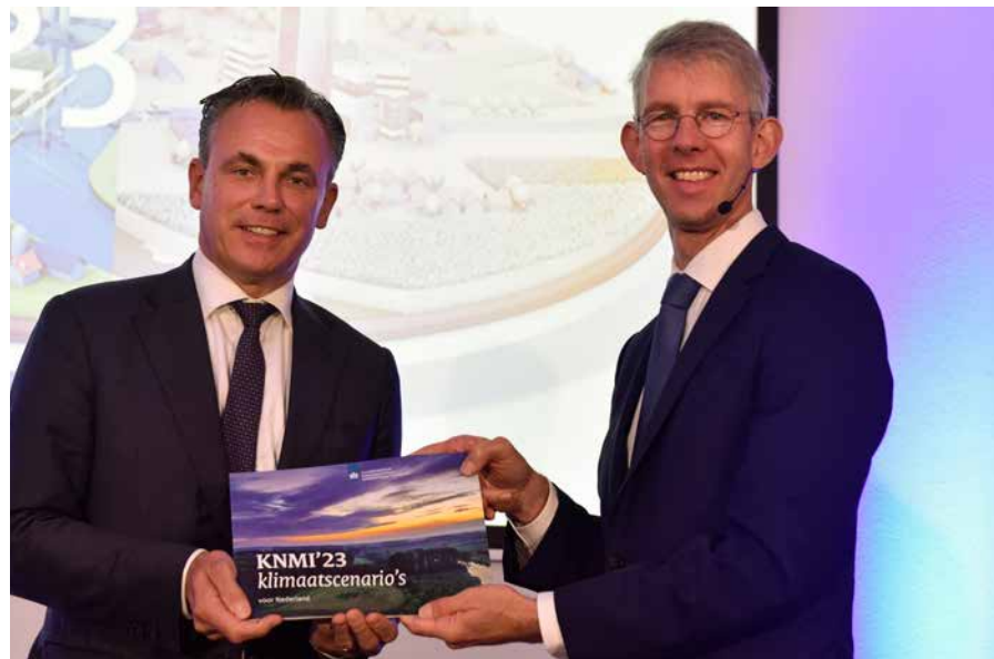
KNMI-hoofddirecteur Van Aalst overhandigt de Klimaatscenario's aan minister van Infrastructuur en Waterstaat Harbers (Foto: KNMI).

Niet eerder zijn de gevolgen die klimaatverandering voor Bonaire heeft, zo scherp in kaart gebracht als in de nieuwe nationale klimaatscenario's die het KNMI op 9 oktober aan minister van Infrastructuur en Waterstaat Mark Harbers heeft aangeboden. Bonaire moet zich voorbereiden op een verdere stijging van de zeespiegel, afhankelijk van het tempo van de opwarming van de aarde van 14 tot 37 cm in 2050 ten opzichte van de gemiddelde zeespiegel in de periode 1995-2014, hogere temperaturen en minder neerslag. "De tijd om na te denken is voorbij", aldus KNMI-hoofddirecteur Maarten van Aalst.