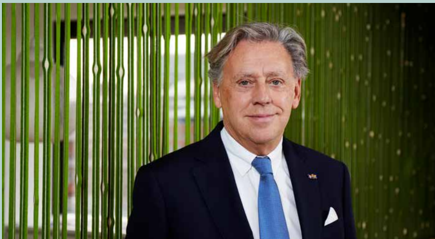
Klimaatbeleid voor Bonaire verdient "topprioriteit" in Den Haag, aldus kwartiermaker Nijpels.

Volgens Nijpels kan dit initiatief leiden tot effectieve ondersteuning op personeels- en financieel terrein en zou het tevens een einde maken aan het "bestuurlijk toerisme" vanuit de ministeries. "Om niet te blijven steken in veel overleg stel ik concreet voor een taskforce van 12 provinciale, gemeentelijke en waterschaps-ambtenaren te organiseren die voor 2 jaar aan Bonaire wordt uitgeleend. Het is niet aan mij de structurele verhoudingen binnen het Koninkrijk verder uit te diepen. Wel geef ik het kabinet ernstig in overweging dit uiteraad gevoelige onderwerp voortvarend op de politiek-bestuurlijke agenda te zetten."