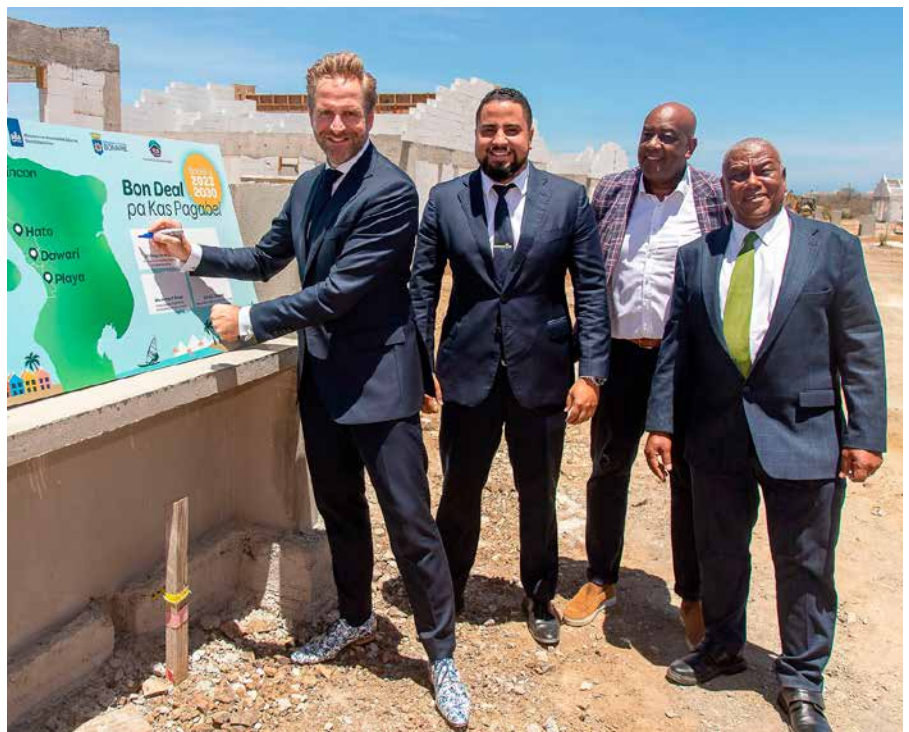
Minister De Jonge tekent de Woondeal in zijn gezelschap van de vlnr gedeputeerde Thielman, FCB-directeur Olena en gedeputeerde Kroon.

De woondeal maakt deel uit van de uitvoering van de beleidsagenda Volkshuisvesting en Ruimtelijke Ordening voor Caribisch Nederland. Deze is eerder dit jaar vastgesteld. Doel is betaalbaar wonen voor meer mensen mogelijk te maken en de leefomgeving op de eilanden te beschermen. Daarom wordt er ook ingezet op verbetering van de huurcompensatie en meer mogelijkheden voor kopers die de financiering van hun koopwoning net niet rond krijgen. Een nieuw ruimtelijk ontwikkelingsprogramma gaat al het mooie en unieke op land en zee beter beschermen.