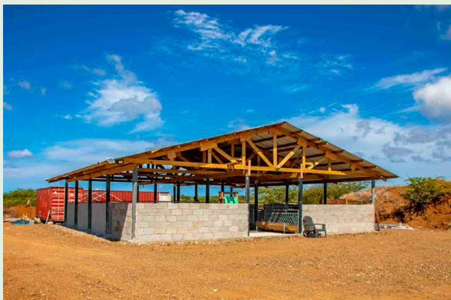
De stal op het LVV-terrein is zo goed als klaar.

Twee net geboren lammetjes ontsnappen de gang naar het slachthuis. "Die zijn door hun moeder verstoten. Ik geef ze de fles. De een is bruin en heb ik Bruintje genoemd. De ander is geboren met een manke poot. Die heet vanwege zijn handicap Mankayon. Nee, ze gaan niet naar de slacht. Ze horen tot de familie."