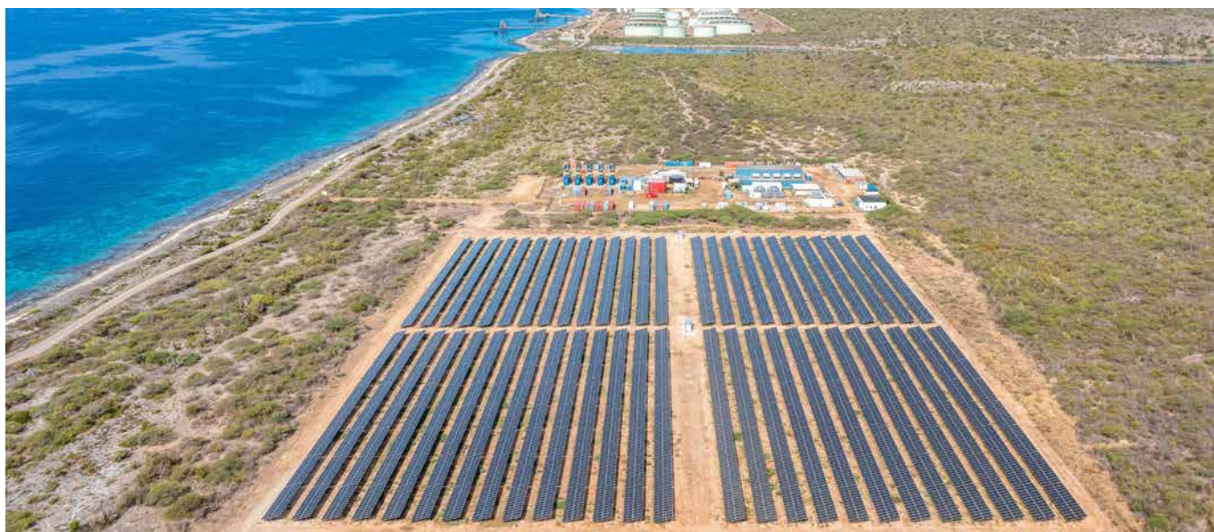
Het nieuwe zonnepark in volle glorie.

Er is gekozen voor een locatie ten zuiden van het vliegveld. Daar kan gebruik worden gemaakt van een bestaande steiger voor de aanvoer van olie. De terminal zal bestaan uit acht tanks van 1000 m 3 . Ter vergelijking: deze zijn meer dan 120 maal kleiner dan de tanks bij Bopec. De terminal zal voldoen aan de hoogste veiligheidsnormen en standaarden en op minimaal 200 meter van (toekomstig) woongebied komen. Op dit moment wordt de Milieu Effect Rapportage afgerond, zodat deze nog dit najaar kan worden beoordeeld door Rijkswaterstaat.