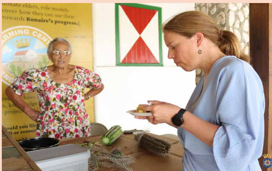
Bij het bezoek aan Mangazina di Rei proefde minister Schouten van de cactussoep.

In 2025 moet het ijkpunt voor een sociaal minimum in Caribisch Nederland stapsgewijs zijn gerealiseerd. Ook moet er dan een vorm van werkloosheidsvoorziening bestaan. Dat belofde minister Carola Schouten (Armoedebeleid, Participatie en Pensioenen) tijdens haar werkbezoek aan Bonaire.