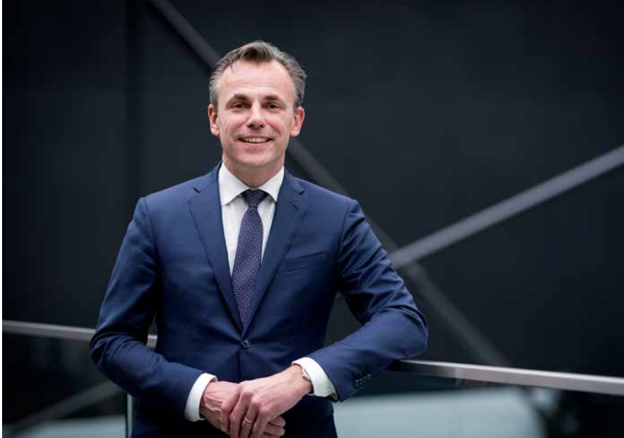
Minister Harbers ziet elektrisch vliegen tussen de ABC-eilanden wel zitten.

Over 4 jaar zullen de eerste vluchten van Bonaire naar Curaçao en Aruba en vice versa met elektrische toestellen kunnen worden uitgevoerd. In 2030 moet de helft van het aantal reizigers tussen de ABC-eilanden elektrisch vliegen en in 2035 vrijwel iedereen. Dat staat te lezen in het Masterplan en de bijbehorende Roadmap Elektrisch Vliegen van het luchthavenadvies- en ingenieursbureau NACO International Aviation Consultancy en het Koninklijk Nederlands Lucht- en Ruimtevaartcentrum.