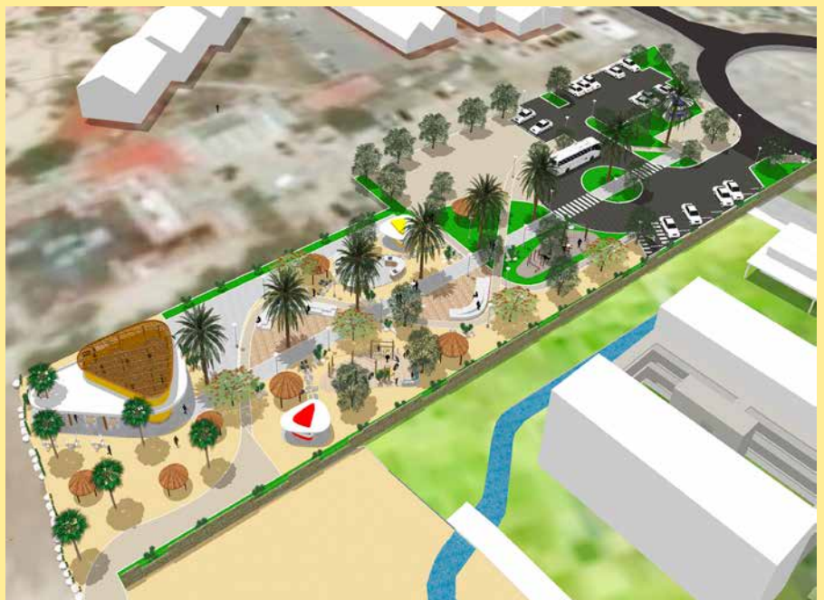
Artist impression van het toekomstige Sunset Beach Park.