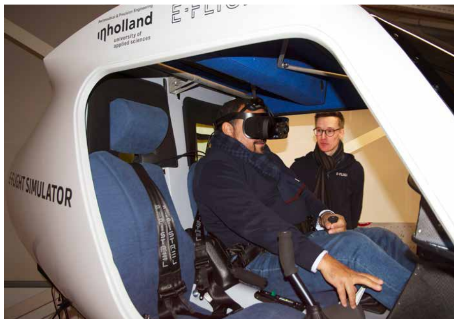
Gezaghebber Rijna maakte in een flight simulator een virtuele elektrische vlucht over Bonaire.

Gezaghebber Rijna benadrukte dat de vlietschool meer dan welkom is. "Wij juichen initiatieven toe die bijdragen aan de verduurzaming van het eiland. Als eerste elektrische vlietschool op het westelijk halfrond zal de academy bovendien veel studenten uit de wijde regio trekken en dat is goed voor de diversificatie van onze economie en werkgelegenheid op een letterlijk en figuurlijk hoog niveau. Er gaan ook lokale instructeurs worden opgeleid." Ter afsluiting van het bezoek maakte de gezaghebber in een flight simulator een virtuele elektrische vlucht over Bonaire.