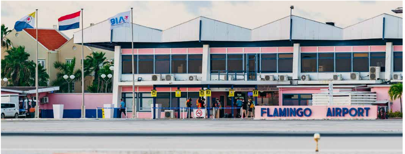
Flamingo Airport in coronatijd.

Hoe hard Bonaire geraakt is door de coronapandemie blijkt uit cijfers van de Caribische afdeling van het Centraal Bureau voor de Statistiek. In plaats van de verwachte groei heeft Bonaire in 2020 bijna 60 procent minder bezoekers ontvangen.