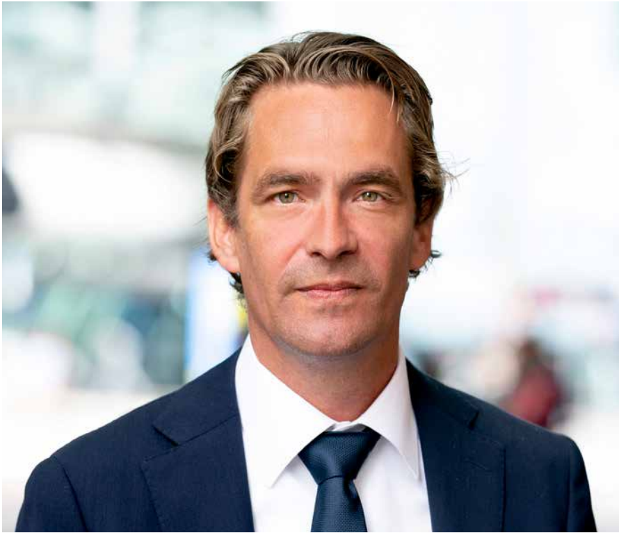
Minister Bas van 't Wout heeft kort na het groene licht van de Kamer Bonaire Brandstof Terminals BV opgericht.

Bonaire kan opgelucht ademen: even leek de Tweede Kamer de oprichting van Bonaire Brandstof Terminals BV op te houden waardoor het eiland in de zomer zonder elektriciteit en drinkwater verstoken dreigde te blijven. Maar na uitleg door minister Bas van 't Wout (Economische Zaken en Klimaat) gaf een ruime Kamermeerderheid alsnog het groene licht.