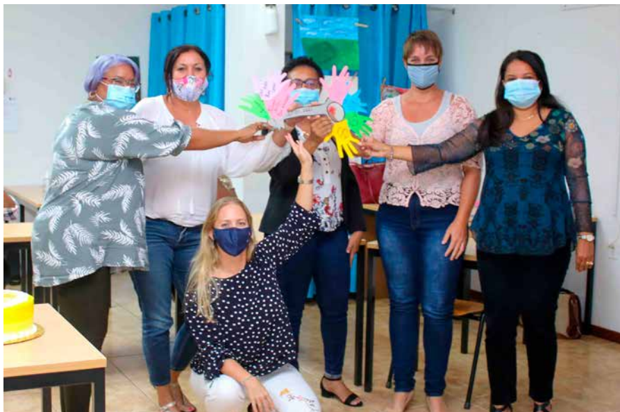
Schoolleiders en opleiders op Bonaire, Curaçao en Aruba juichen de samenwerking toe.

sity of St. Martin deel uit. Kibrahacha komt voort uit het Vierlandenoverleg van de ministers van onderwijs van Curaçao, Aruba, Sint Maarten en Nederland. Zij ondertekenden een samenwerkingsprotocol om lerarenopleidingen in het Caribisch deel van het Koninkrijk te versterken. Minister Ingrid van Engelshoven (OCW) heeft hiervoor 380.000 dollar beschikbaar gesteld.