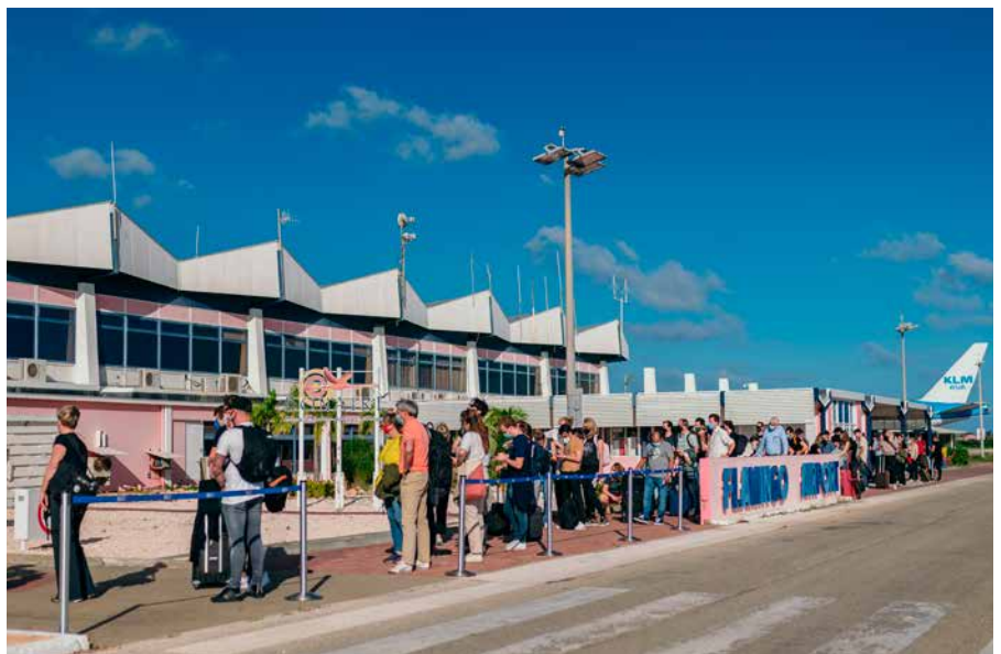
Voor een vakantie op Bonaire staan toeristen graag (even) in de rij.

I: www.tourismbonaire.com/strategictourismplan