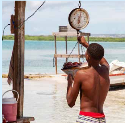
Good Fish pleit voor de introductie van de VISwijzer in Caribisch Nederland.

De afgenomen beschikbaarheid van betaalbaar, vers en gezond voedsel van eigen bodem heeft eveneens gevolgen voor de volksgezondheid: er wordt meer suiker- en vetrijk voedsel geconsumeerd. Dit leidt tot een toename van welvaartsziekten zoals overgewicht, hart- en vaatziekten en diabetes, stelt de WUR vast. Op Bonaire is onder regie van de dienst Landbouw, Veeteelt en Visserij een campagne gestart om lokale landbouw actief te promoten.