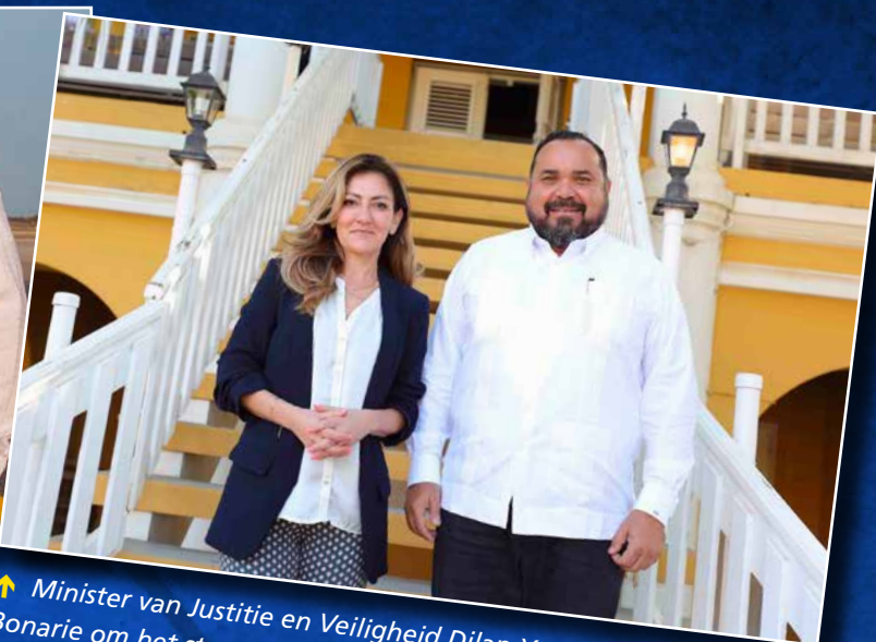
⬆ Minister van Justitie en Veiligheid Dilan Yeşilgöz-Zegerius bezocht Bonarie om het startsein te geven voor het Regionaal Informatie- en Expertise Centrum Caribisch Nederland.