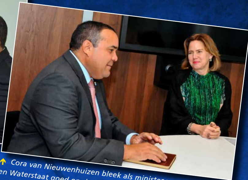
↑ Cora van Nieuwenhuizen bleek als minister van Infrastructuur en Waterstaat goed op de hoogte van de slechte staat van het wegennet op Bonaire.