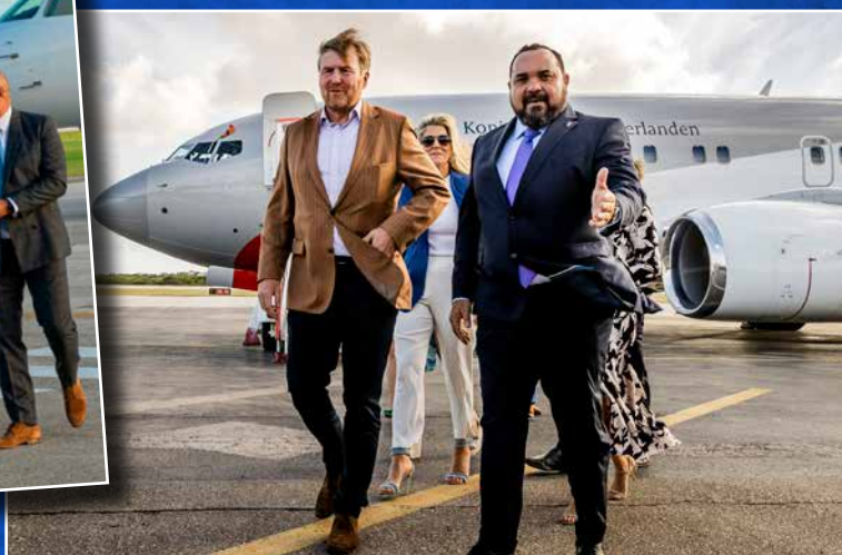
⬆ In januari was het koninklijk paar samen met kroonprinses Amalia terug op Bonaire.