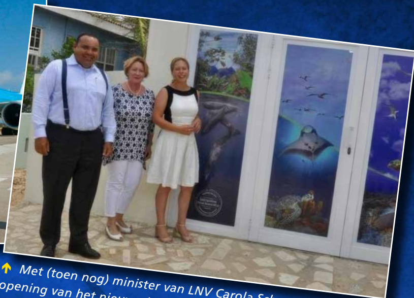
↑ Met (toen nog) minister van LNV Carola Schouten bij de opening van het nieuwe kantoor van de Dutch Caribbean Nature Alliance.