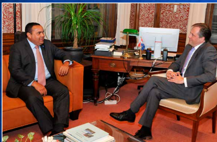
↑ Overleg met toenmalig voorzitter van de Tweede Kamercommissie voor Koninkrijksrelaties Alexander Pechtold.