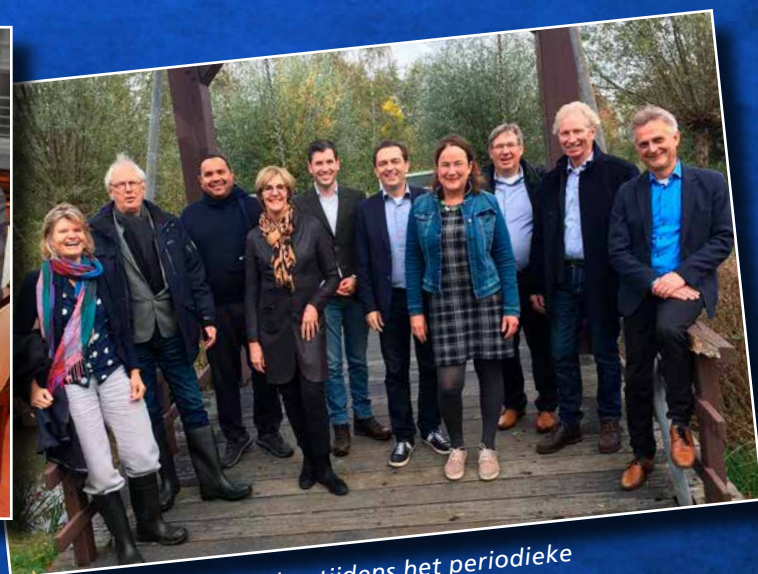
↑ Ervaringen uitwisselen tijdens het periodieke 'burgemeestersklasje'.