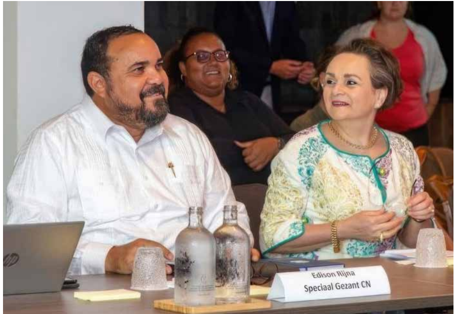
Samen sta je sterker, hield staatssecretaris Van Huffelen de deelnemers aan de workshop over EU-fondsen voor.