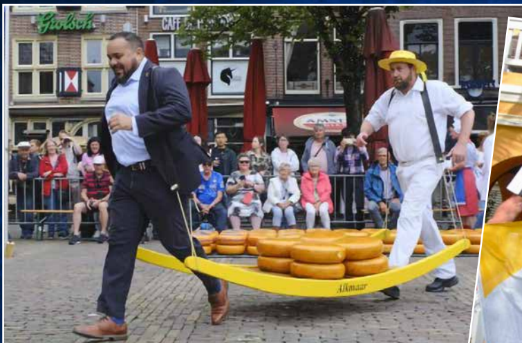
↑ Sommige activiteiten zijn niet in een categorie te vatten, maar deze pagina maakt duidelijk dat je als gezaghebber van veel markten thuis moet zijn.