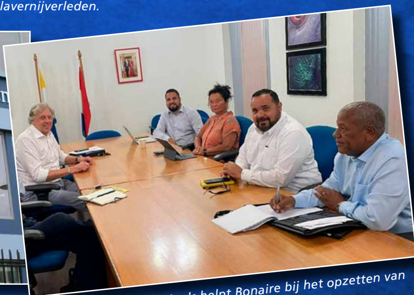
⬆ Klimaatexpert Ed Nijpels helpt Bonaire bij het opzetten van een Klimaattafel.