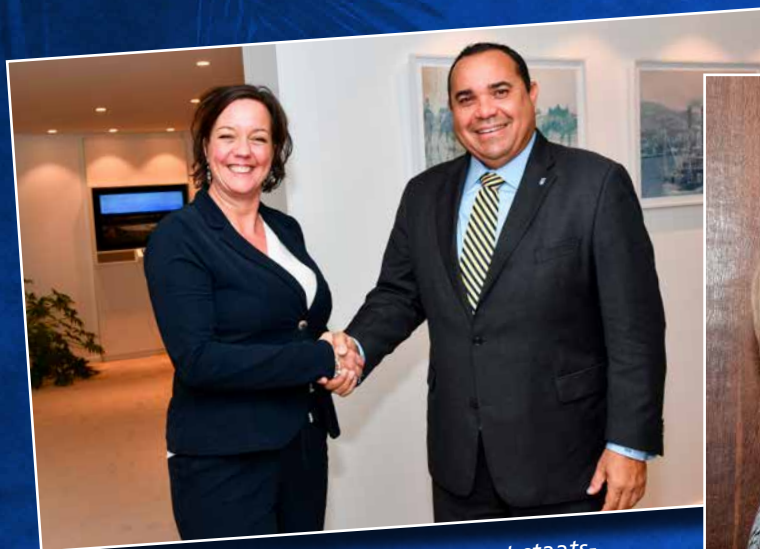
↑ Terugkerend gespreksonderwerp met staatssecretaris Tamara van Ark (SZW) was het ontbreken van een sociaal minimum in Caribisch Nederland.