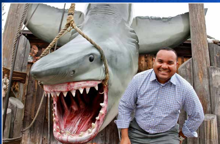
↑ Niet bang uitgevallen.