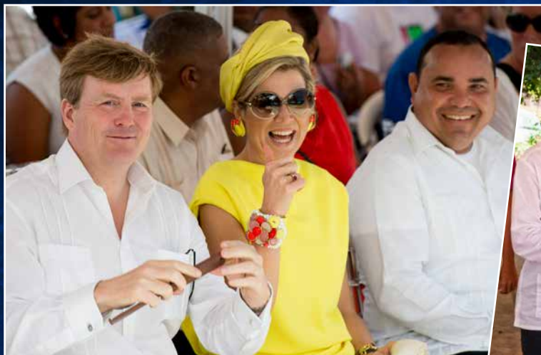
⬆ Koning Willem-Alexander en koningin Máxima vierden in 2015 Dia di Rincon mee.