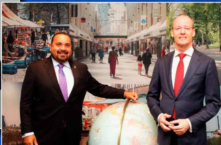
↑ Overleg met DNB-president Klaas Knot over het toezicht op financiële instellingen in Caribisch Nederland.