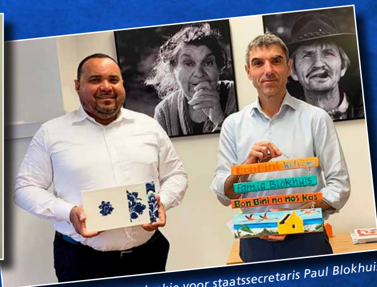
↑ Een welgemeend bedankje voor staatssecretaris Paul Blokhuis (OCW) voor de steun tijdens de coronapandemie.