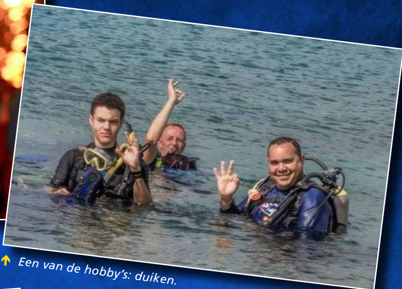
↑ Een van de hobby's: duiken.