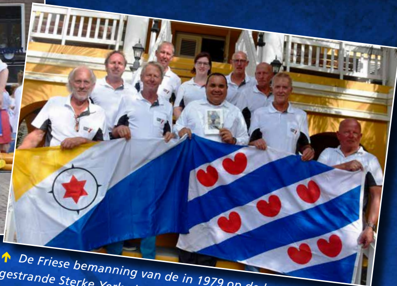
↑ De Friese bemanning van de in 1979 op de kust van Bonaire gestrande Sterke Yerke keerde terug om het herinneringsmonument te restaureren.