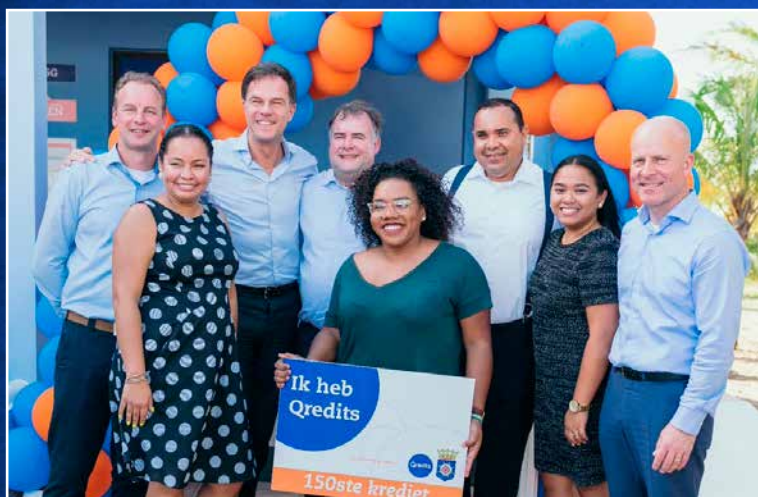
↑ Bij de opening van het kantoor van kredietverstrekker Qredits.