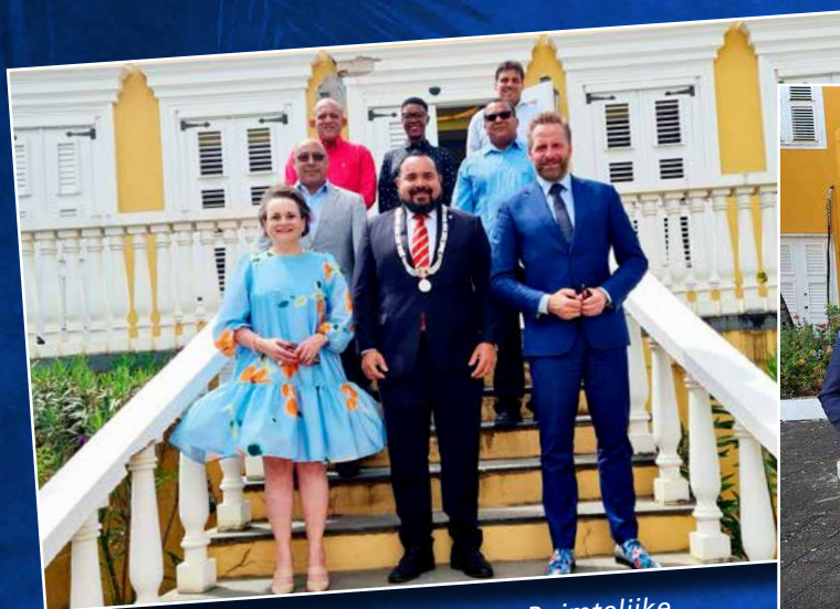
⬆ Minister voor Volkshuisvesting en Ruimtelijke Ordening Hugo de Jonge werkt aan een ruimtelijk ontwikkelingsplan voor Bonaire.