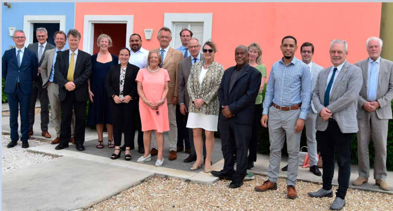
Aan aandacht uit Den Haag geen gebrek. Begin dit jaar was een delegatie van Tweede en Eerste Kamerleden op bezoek.

"Hoe bedoelt u dat? Ik ben mij daar totaal niet bewust van."