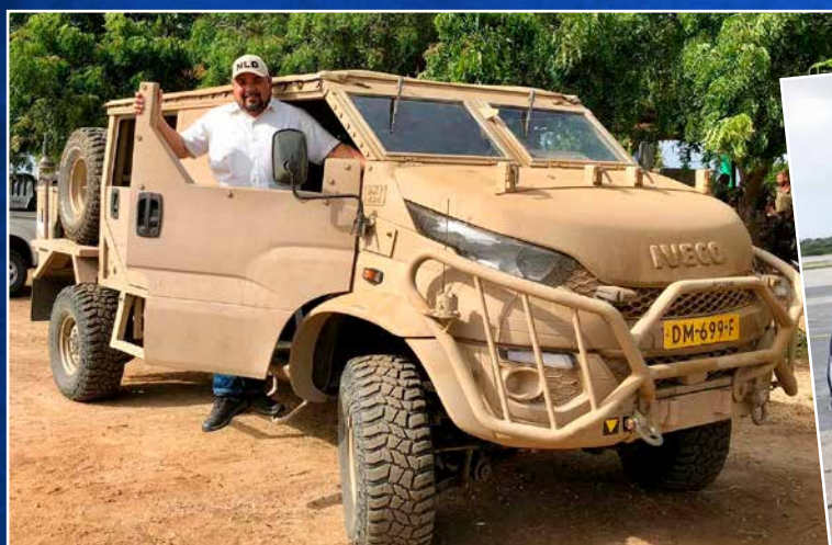
↑ Defensie zorgt ook voor de territoriale veiligheid in de Cariben.