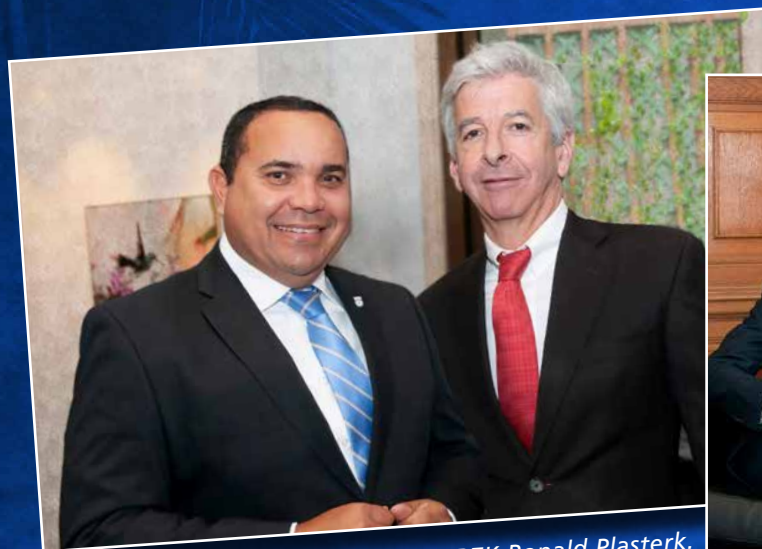
↑ Kennismaking met minister van BZK Ronald Plasterk.