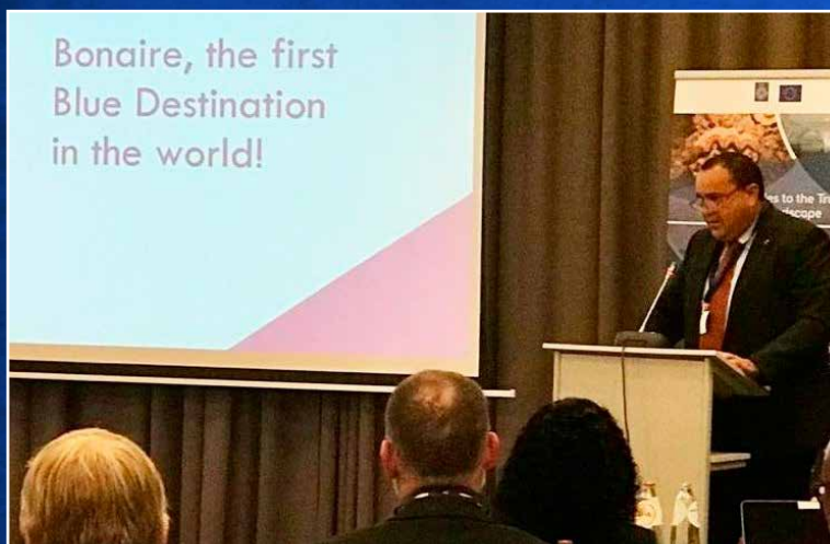
↑ Presentatie van het Blue Destination-concept tijdens een oceanenconferentie in Brussel.