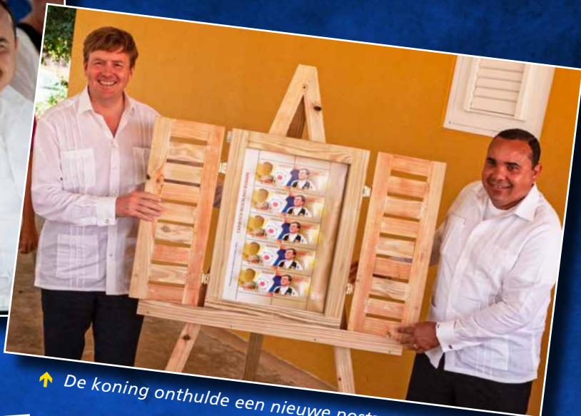
⬆ De koning onthulde een nieuwe postzegelserie.