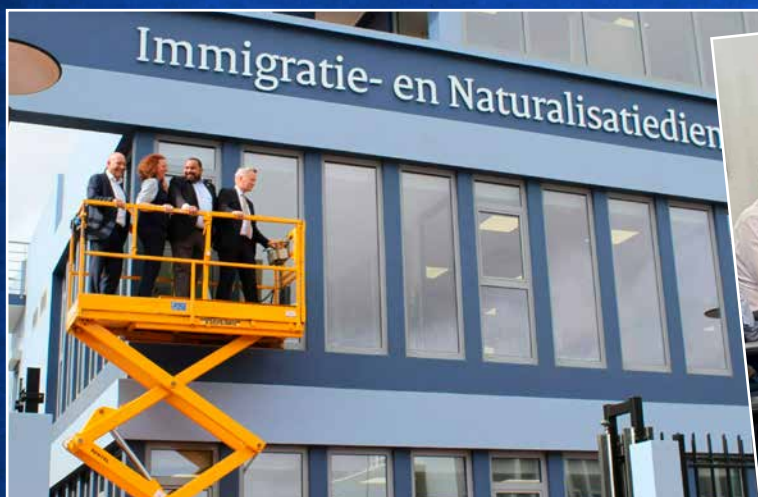
⬆ Met staatssecretaris van J&V Eric van der Burg bij de opening van het nieuwe onderkomen van de IND.