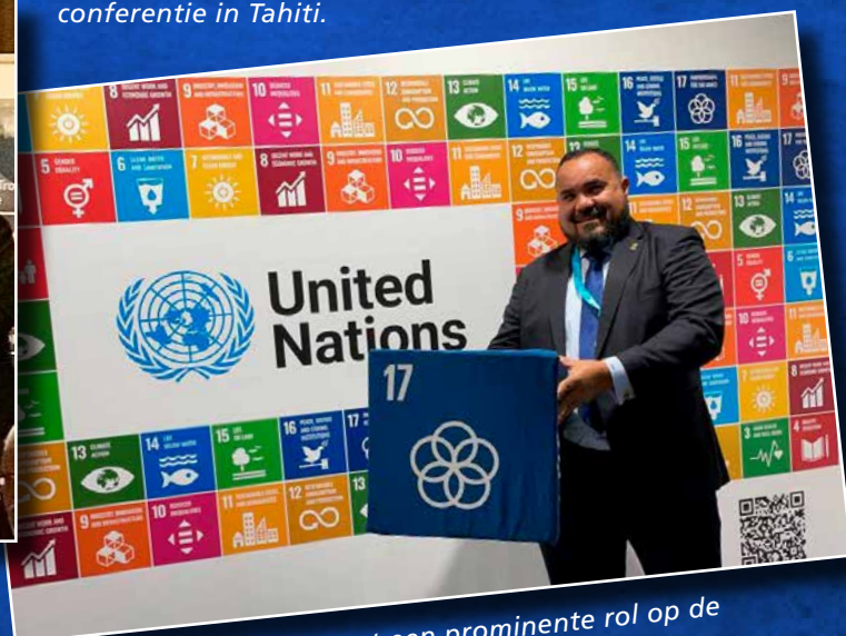
↑ Bonaire speelde in maart een prominente rol op de VN Waterconferentie in New York.