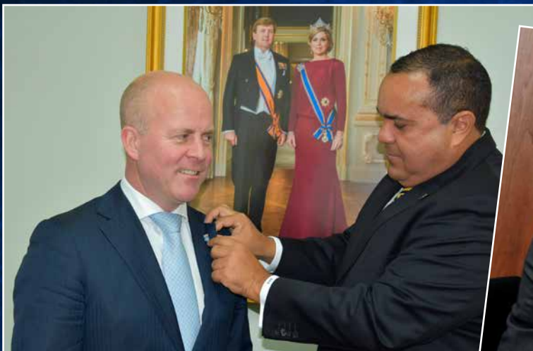
↑ Een Bonaire-speldje voor de net aangetreden staatssecretaris van Koninkrijksrelaties Raymond Knops.