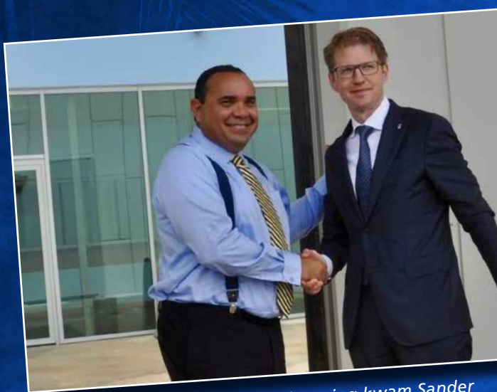
↑ Als minister voor Rechtsbescherming kwam Sander Dekker naar Bonaire voor de opening van de nieuwe gevangenis.