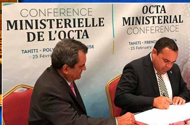
↑ Als lid van de Overseas Countries and Territories Association nam de gezaghebber deel aan een ministers-conferentie in Tahiti.