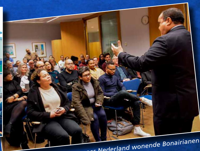
↑ In gesprek met in Europees Nederland wonende Bonairianen.