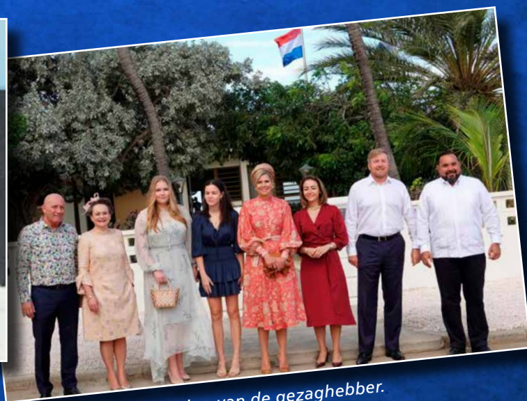
⬆ Voor de ambtswoning van de gezaghebber.