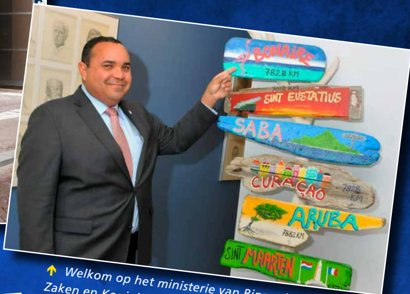
↑ Welkom op het ministerie van Binnenlandse Zaken en Koninkrijksrelaties.