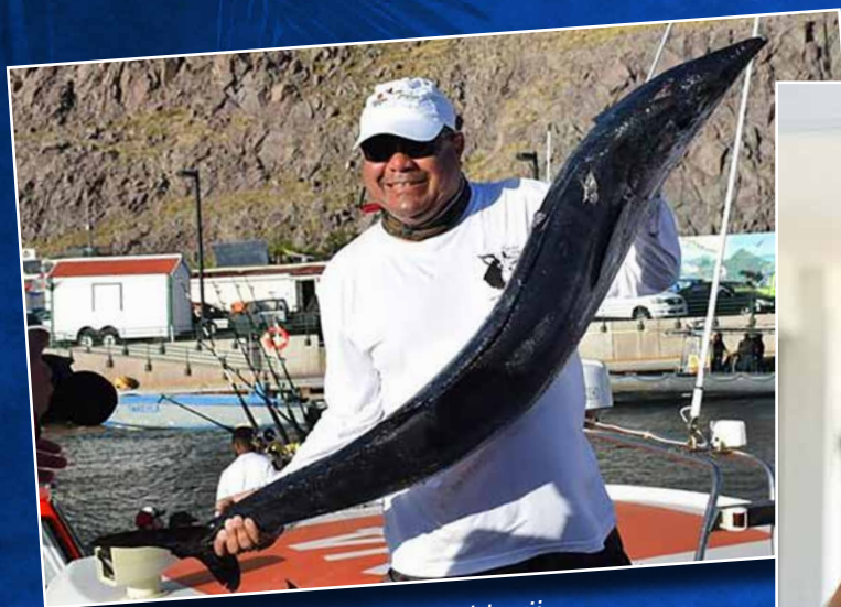
↑ Zeevissen is een andere liefhebberij.