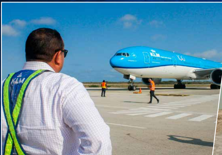
↑ Geen gemeente die zo vaak bewindslieden op bezoek krijgt, dus spoedt de gezaghebber zich geregeld naar Flamingo Airport.