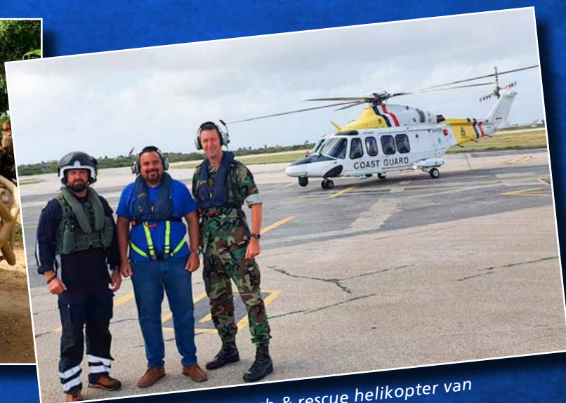
↑ Een rondje met de search & rescue helikopter van de Kustwacht.