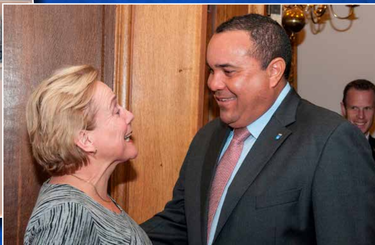
↑ Op bezoek bij minister van Defensie Ank Bijleveld, mede-architect van de status van Bonaire als bijzondere gemeente.