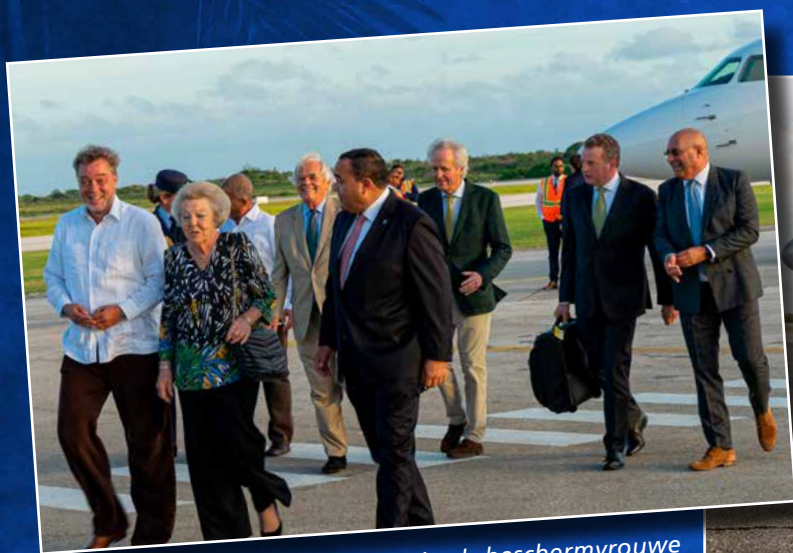
⬆ In 2017 bezocht prinses Beatrix als beschermvrouwe van de Dutch Caribbean Nature Alliance Bonaire.