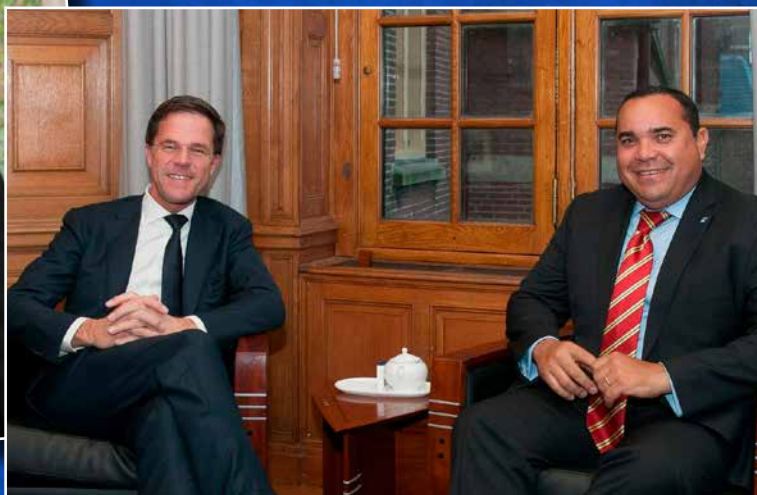
↑ Minister-president Mark Rutte laat zich geregeld bijpraten over de ontwikkelingen in het Caribisch deel van het Koninkrijk.