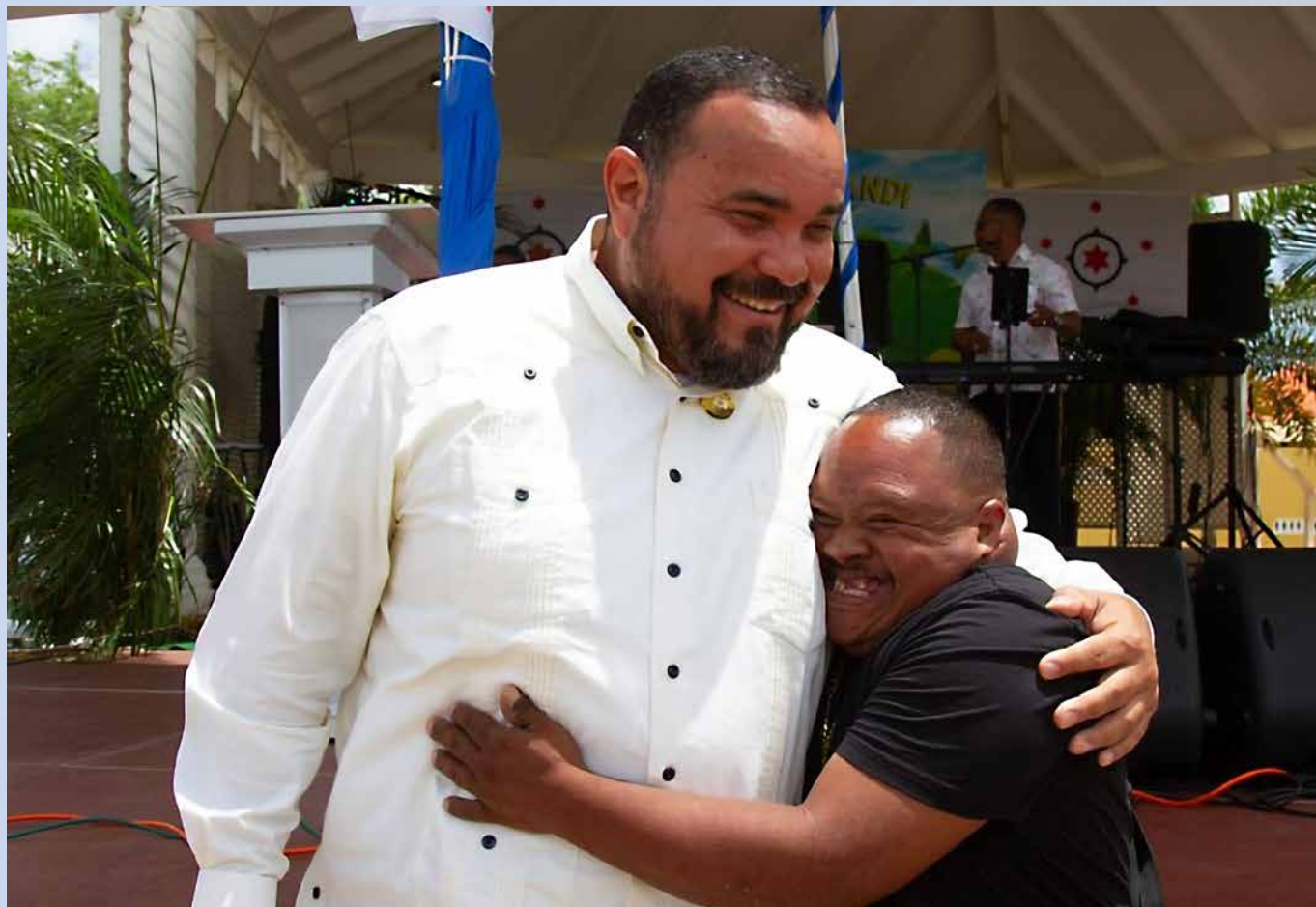
Burgervader in optima forma.

"Dat het een grote eer is deze functie ruim negen jaar te hebben mogen uitoefenen. Van bestuurders wordt wel eens gezegd dat ze twee leuke werkdagen hebben. De eerste en de laatste. Ik voel me gezegend, want ook daar tussenin heb ik veel leuke dagen gehad. Als ik nog een keer geboren word, doe ik het zo weer."