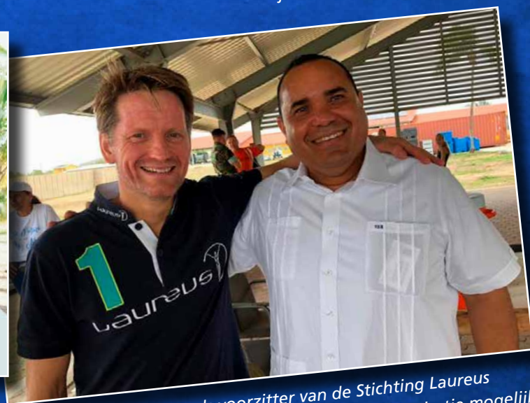
↑ Prins Maurits kwam als voorzitter van de Stichting Laureus Foundation een kijkje nemen bij een door zijn organisatie mogelijk gemaakt sportevenement.