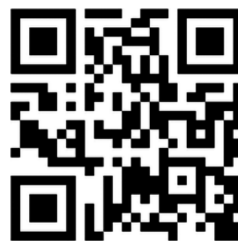
Bekijk hier de videoregistratie van de afscheidsreceptie.