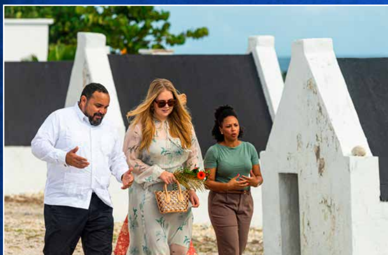
⬆ Onderdeel van het bezoek was een bezoek aan de slavenhuisjes.