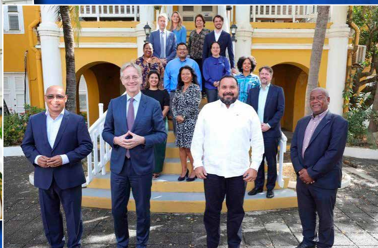
⬆ Minister Robbert Dijkgraaf (OCW) kwam niet alleen voor onderwijszaken, maar wilde ook spreken over het slavernijverleden.