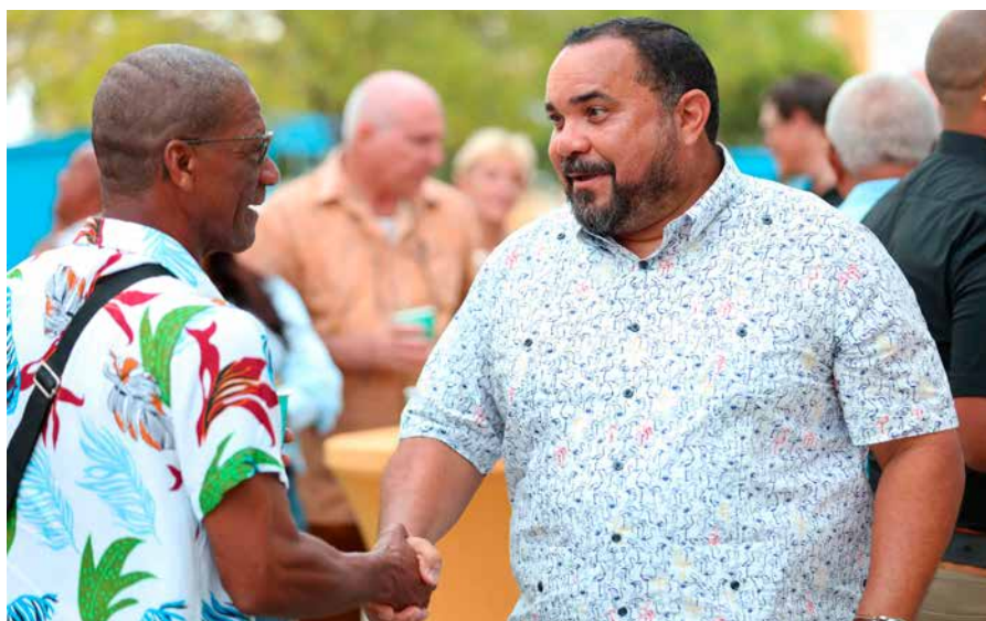
Veel Bonairianen maakten gebruik van de gelegenheid hun gezag uit te zwaaien.

rondjes te blijven draaien. Aan de andere kant paste hij ook altijd