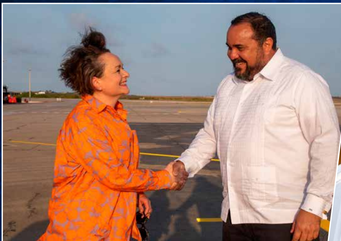
⬆ Een warm welkom op Flamingo Airport voor de in januari 2022 aangetreden staatssecretaris van Koninkrijksrelaties Alexandra van Huffelen.