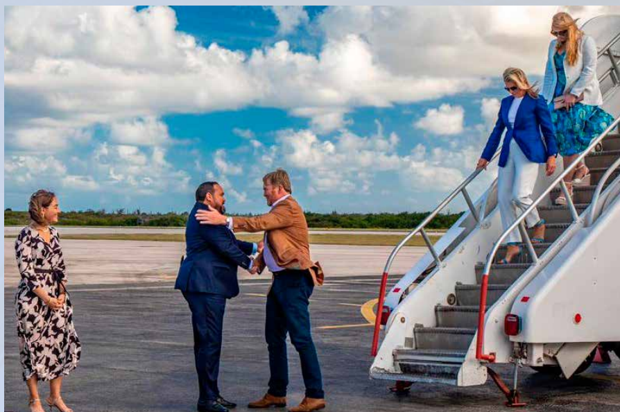
Koninklijke bezoeken behoren tot de hoogtepunten in het leven van een gezaghebber.

"Ik denk dat de cultuuromslag dat de overheid er is voor de samenleving en niet andersom zich begint af te tekenen. Tegelijkertijd moet ik erkennen dat die zich langzamer voltrekt dan ik had gehoopt. Het ambtelijk apparaat heeft alle zeilen moeten bijzetten om de snelle groei van het eiland bij te benen. Daarnaast worden we nog te veel gehinderd door wet- en regelgeving uit de tijd van de Nederlandse Antillen. Daarin zit veel bureaucratie besloten. Ik had daar zelf veel meer energie in willen stoppen. Maar ik ben er achter gekomen dat je als gezaghebber wordt geleefd door ge-