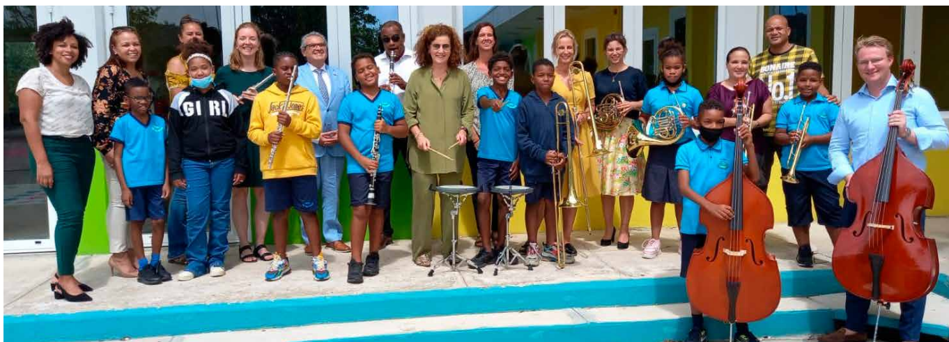
Samen met het leerorkest van Kolegio San Luis Beltran.

De minister had een vol programma. Ze bracht een bezoek aan de Brede School Papa Cornes, één van de scholen die leraren opleidt via het concept van Samen Opleiden & Professionaliseren, een leerwerkbedrijf en de IT Academy van de Scholengemeenschap Bonaire. Ze genoot de lunch bij restaurant Chez Nous, voorbereid door VM-BO-leerlingen en uitgeserveerd door SLP-leerlingen van de SGB. Van Engelshoven had voorts een ontmoeting met deelnemers van het TOP traineeprogramma, ging in gesprek met EQ Bonaire over LHBT-rechten en bezocht in Rincon het cultuurpark Mangazina di Rei. Bij het Kolegio San Luis Beltran woonde ze een muziekles van het leerorkest bij. Met het Bestuurscollege sprak de minister onder meer over de doorstroomproblematiek van studenten en de inzet voor de onderwijsagenda 2022-2026.