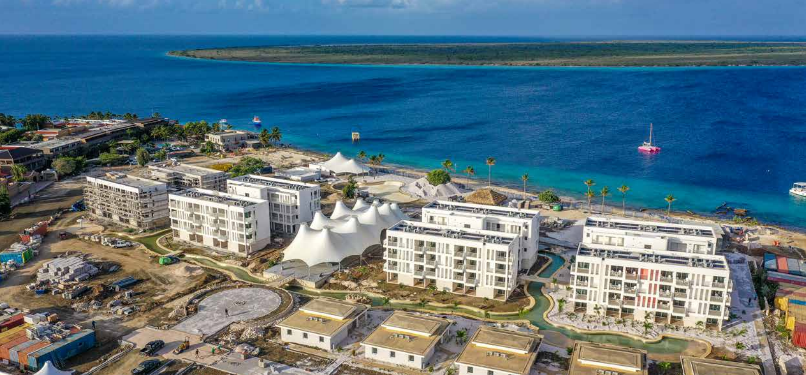
Het nieuwe resort is schitterend gelegen met uitzicht op het natuurparadijsje Klein Bonaire.

De naam Chogogo past goed bij Bonaire: het betekent flamingo