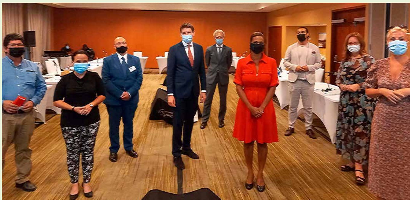
Een delegatie van Eerste en Tweede Kamerleden liet zich tijdens haar recente werkbezoek aan Bonaire informeren over het plan van WEB de elektriciteitsproductie te vergroenen.

bedrijvigheid bijhouden. En dat ook nog eens op een duurzame manier die bovendien leidt tot een lager tarief. Dat is goed voor de burgers, onze economie en het milieu." ●