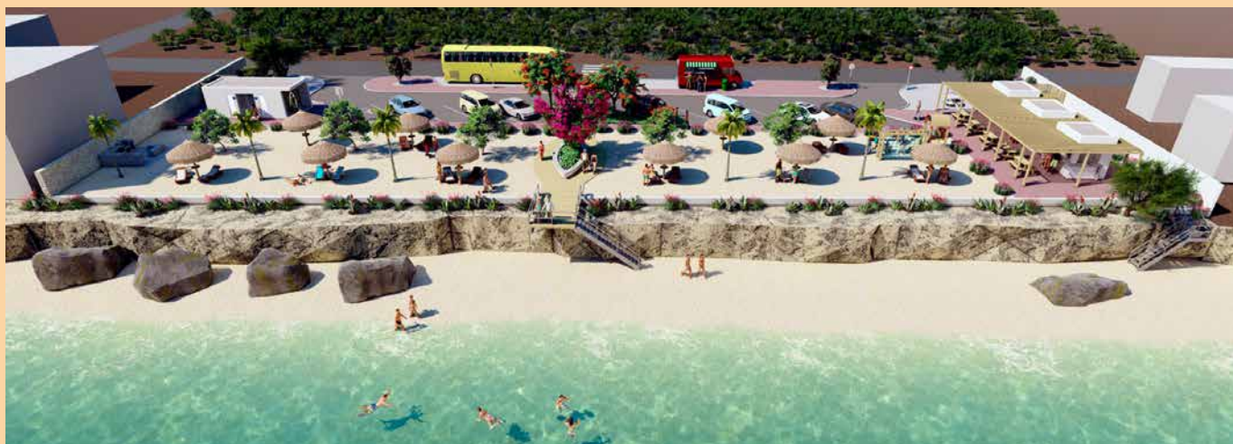
Artist impressions maken duidelijk wat de bedoeling van de upgrading is.