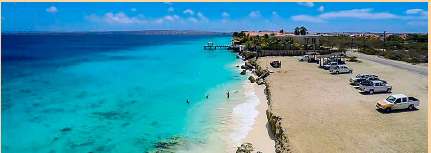
De huidige situatie.

De reacties die na de presentatie van de eerste schetsen zijn losgekomen uit de gemeenschap worden verwerkt in het definitieve ontwerp. “We hebben goede suggesties gekregen. Er waren ook mensen die zich zorgen maakten dat ze straks geen eigen eten en drinken meer zouden mogen meenemen. Met de hele familie en tassen vol naar de beach is een traditie die we in ere houden, net als het gebruik van de barbecue”, belooft gedeputeerde Thielman. ●