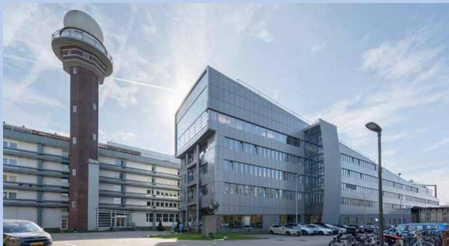
Het KNMI-kantoor in De Bilt met op de toren een weerradar.

zuidkust kwetsbaar voor, staat te lezen in Klimaatsignaal'21. "Maar het risico is klein: een stijging van bijvoorbeeld veertig centimeter doet zich maar een keer in de duizend jaar voor. In de klimaatscenario's zal daar dieper op worden ingegaan, want een verdere opwarming van de aarde heeft daar wel invloed op. We zijn nu bijvoorbeeld aan het berekenen wat het effect van orkaan Irma (die in 2017 de Bovenwindse eilanden hard raakte; red) zou zijn als het twee graden warmer is", aldus Siegmund.