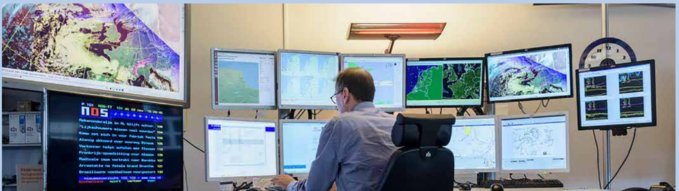
De data over het weer op Bonaire worden real-time gevolgd in de weerkamer van het KNMI in De Bilt.

Wat wel op Bonaire waarneembaar is, is de opwarming van de aarde. "De temperatuurstijging is sinds de jaren 80 zo'n 0,15 graden per tien jaar. Dat is vergelijkbaar met Europees Nederland. In ons rapport is tevens een paragraaf opgenomen over de terugkeertijd van orkanen die op minder dan 250 kilometer passeren. Orkanen van de hoogste categorie 5 doen zich eens in de 76 jaar voor op of nabij Bonaire, die van de lichtste categorie 1 elke vier jaar." Naast schade door hoge windsnelheden en grote hoeveelheden regen brengen orkanen het risico van stormvloed met zich mee. Bonaire is daar met zijn lage en rond Kralendijk dichtbebouwde