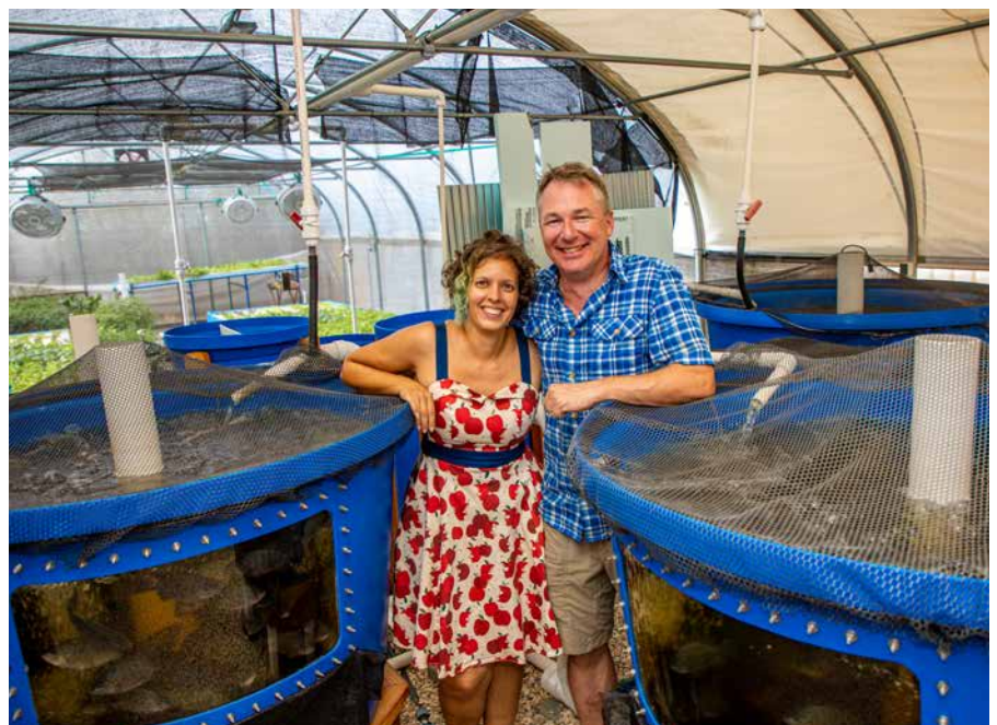
De combinatie van vis kweken en groente telen, maakt een gesloten ecologische kringloop mogelijk.

Duurzaam zijn ook de – dankzij de bijna altijd aanwezige passaat-